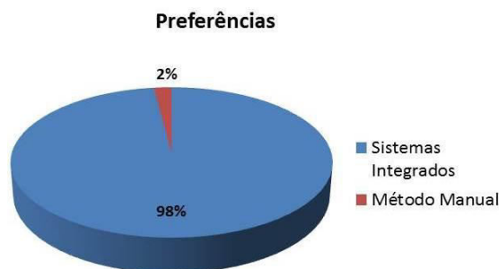
Gráfico 2 – Análise da preferência dos profissionais contábeis.

aliado, presente no dia a dia destas empresas.